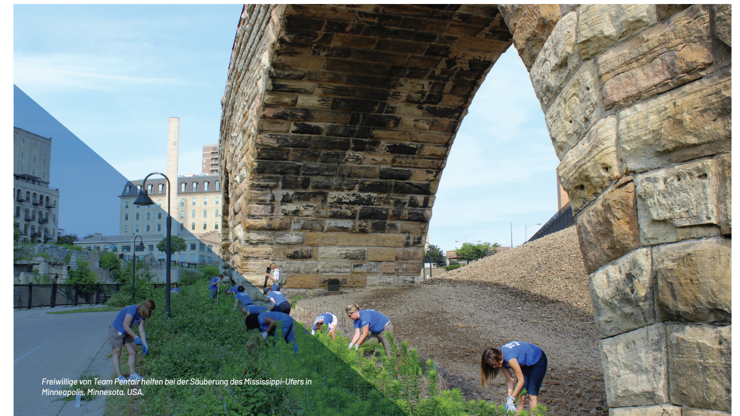
Freiwillige von Team Pentair helfen bei der Säuberung des Mississippi-Ufers in Minneapolis, Minnesota, USA.

Jeglicher Verzicht, eine Bestimmung des Verhaltenskodex für Executive Officers oder Directors durchzusetzen, darf ausschließlich durch den Vorstand von Pentair oder den Vorstandsausschuss für Unternehmensführung vorgenommen werden.