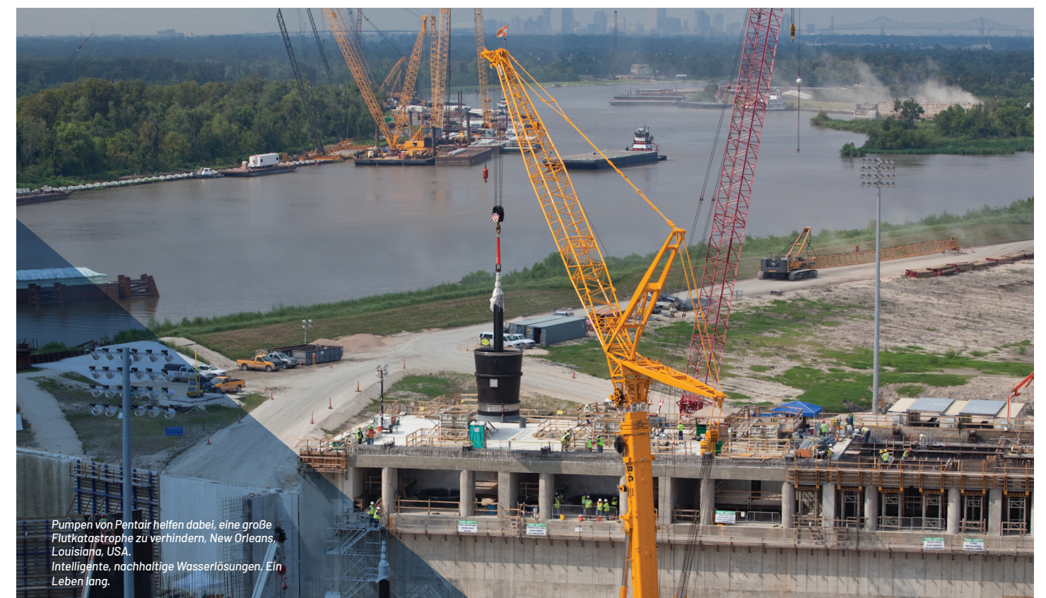
Pumpen von Pentair helfen dabei, eine große Flutkatastrophe zu verhindern, New Orleans, Louisiana, USA. Intelligente, nachhaltige Wasserlösungen. Ein Leben lang.

A: Die Reise zum Werk kann gegebenenfalls zulässig sein, die Reise zu Disney World ist unzulässig und stellt eine Form von Bestechung dar. Wir dürfen unter keinen Umständen für die Reisekosten von Familienmitgliedern unserer Kunden aufkommen oder eine Reise zu Disney World oder sonstigen Reisezielen finanzieren, die keine Beziehung zum Geschäftsbetrieb von Pentair aufweisen.