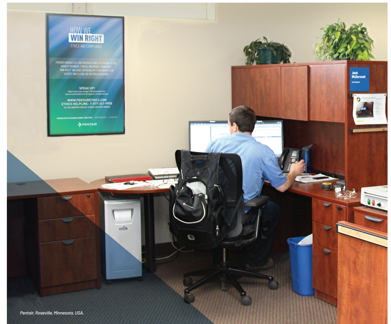
Pentair, Roseville, Minnesota, USA.

A: Pentair nimmt Beschwerden in Bezug auf Vergeltungsmaßnahmen sehr ernst. Dazu gehört auch, dass Mitarbeiter und Management informiert werden, wie Vergeltungsmaßnahmen aussehen und was die Konsequenzen sind. Wenn Behauptungen über Vergeltungsmaßnahmen belegt werden, wird Pentair die beteiligten Personen zur Rechenschaft ziehen – bis hin zur Kündigung.